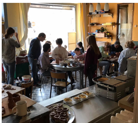
Espace de Vie Sociale